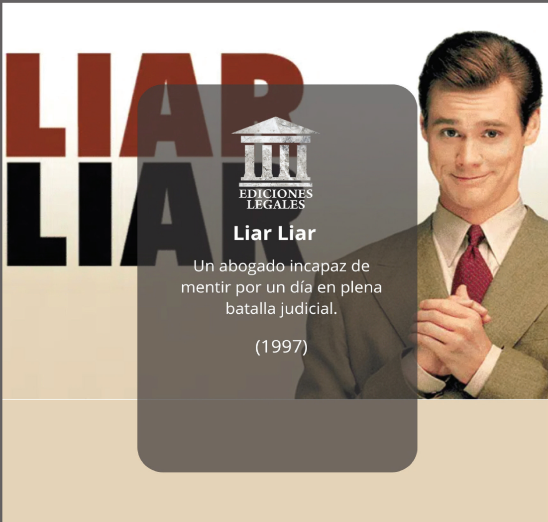
Liar Liar (1997)

Una comedia protagonizada por Jim Carrey que todo abogado debería ver.